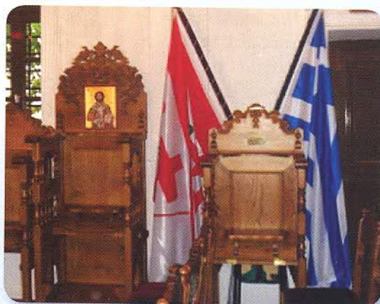
Το στασίδι του Ναυάρχου όπως είναι σήμερα.