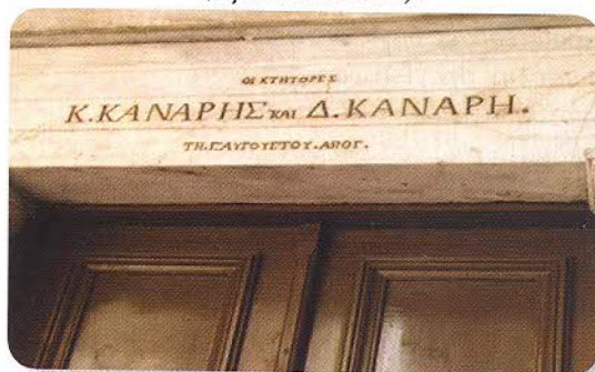
Η κτητορική επιγραφή εις το υπέρθυρον της εισόδου (3 Αυγούστου 1873 - ΑΛΟΓ).