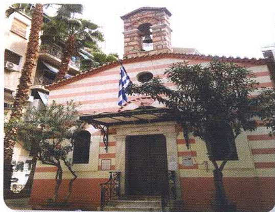
Το εκκλησάκι του Κανάρη στην Κυψέλη (Άγιοι Απόστολοι).

Όμως, από τις διάφορες πηγές, η πιο καλά εστιασμένη στο εκκλησάκι του Ναυάρχου ανήκει στον Αλέξανδρο Μωραϊτίδη (κατόπιν μοναχός Ανδρόνικος), ο οποίος, σε άρθρο του στο Πε- ριοδικό «Οι Τρεις Ιεράρχαι» (1925), δίνει μια γλαφυρή περιγραφή της ευρύτερης περιοχής αλλά και του ευλαβούς «μεταπολεμικού» Κανάρη: [1,9] «Εκείνα τα χρόνια η Πρωτεύουσα εξετείνετο μέχρι των Χαυτείων. Πέραν ηπλούτο το Πολύγωνον, ή το Πεδίον του Άρεως με τον Ναόν των Ταξιαρχών, ένα πολύ μικρόν και πολύ πτωχικόν Εκκλη- σιδάκι. Και μετά τινά ερημικόν χειμαρρον ευρισκόμεθα εις την Κυψέ- λην, όπου η έπαυλις του δαφνοστεφούς Πυρπολητού και ο Ναός του, οι Άγιοι Απόστολοι. Εκείνα τα χρόνια λέγων τις Κυψέλη, εννοούσεν έπαυλιν Κανάρη. Μέσα εις την ερημίαν μια δροσερωτάτη πρασινοβο- λή, μία όασις τα μάλα εύαρεστος. Ολίγον παραπέρα από την Αγίαν Ζώνην, εκεί εις την άκραν των Πατησίων, μέσα εις τους κήπους και τους ανθώνας του τότε συνοικιζόμενου δροσοβρέκτου Προαστείου. Πόσας φορές ελειτουρηθήν τας πρωϊας της Ανοιξεως, και πόσας φο- ράς ηγρύπνησα εις πανηγυρικήν αγρυπνίαν μεγάλης εορτής, ότε ένα καιρόν είχαν καταδιωχθεί αι Αγρυπνίαι του Αγίου Ελισσαίου.