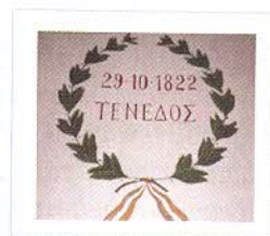
Οι «δαφνοστεφανωμένοι» άθλοι του Πυρπολητή στους τοίχους του Ναού.