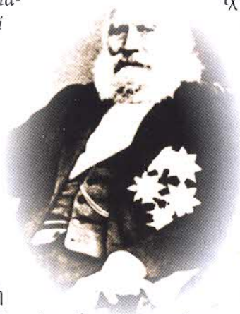
Ο «πολιοκρόταφος ήρωας»

Σε άλλο σημείο του κειμένου ο Συμυρνιός αρθρογράφος της «Νέας Εστίας» δεν κρύβει τη «ρωμαίικη» πικριάν του και διατυπώνει, με καυστικό τρόπο, οξύτατο «εθνικό αυτοσαρκασμό» [2] λέγοντας: «Ο κισσός παιγνιδίζει ηλιόχαρος στα μάτια μόνο της φαντασίας και των αναμνήσεων, η τζαμαρία έχει πάθει κι αυτή τις μεταμορφώσεις που επιβάλλει το πνεύμα της εποχής, κι ένα μανάβικο με τον μετρίοφρονα τίτλον "Ο Κανάρης" έχουν καταλάβει το κάτω μέρος του σπιτιού [...] Μία πινακίδα σαν κι αυτές που μπαίνουν χιλιάδες σε όλη την Ελλάδα, για να πετάγονται κατόπι στα